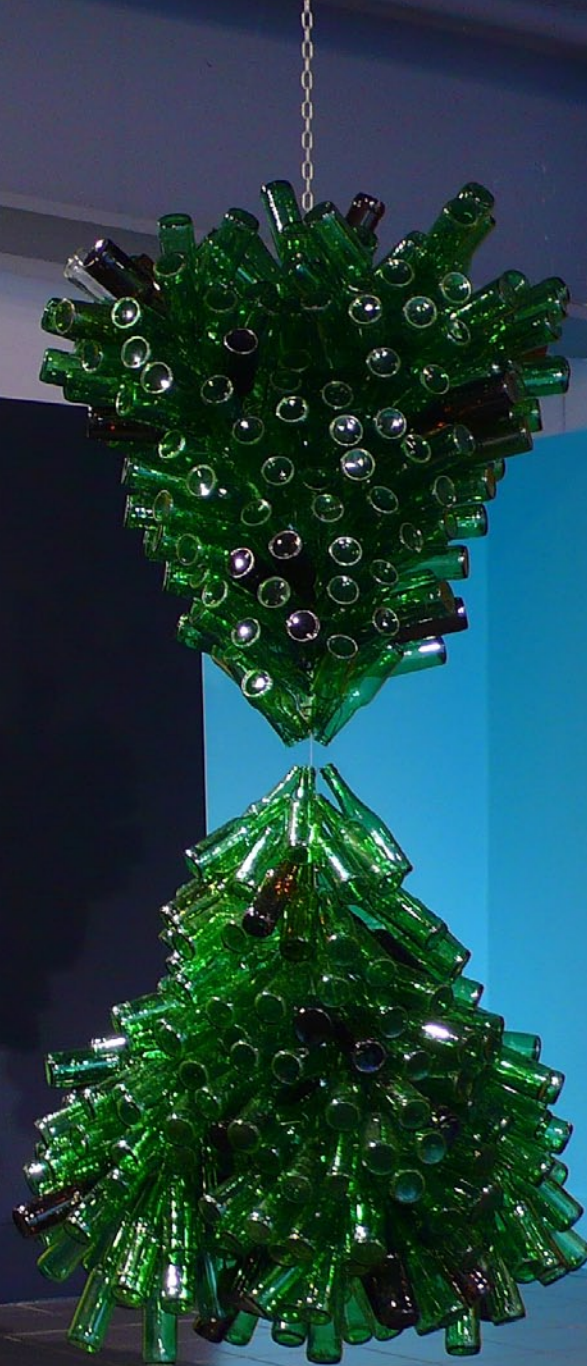
Hour Glass 2010, bouteilles en verre, rayons de bicyclette, chaîne exposition Re-Make Re-Model , National Glass Center, Sunderland, UK; Photo: Colin Davison