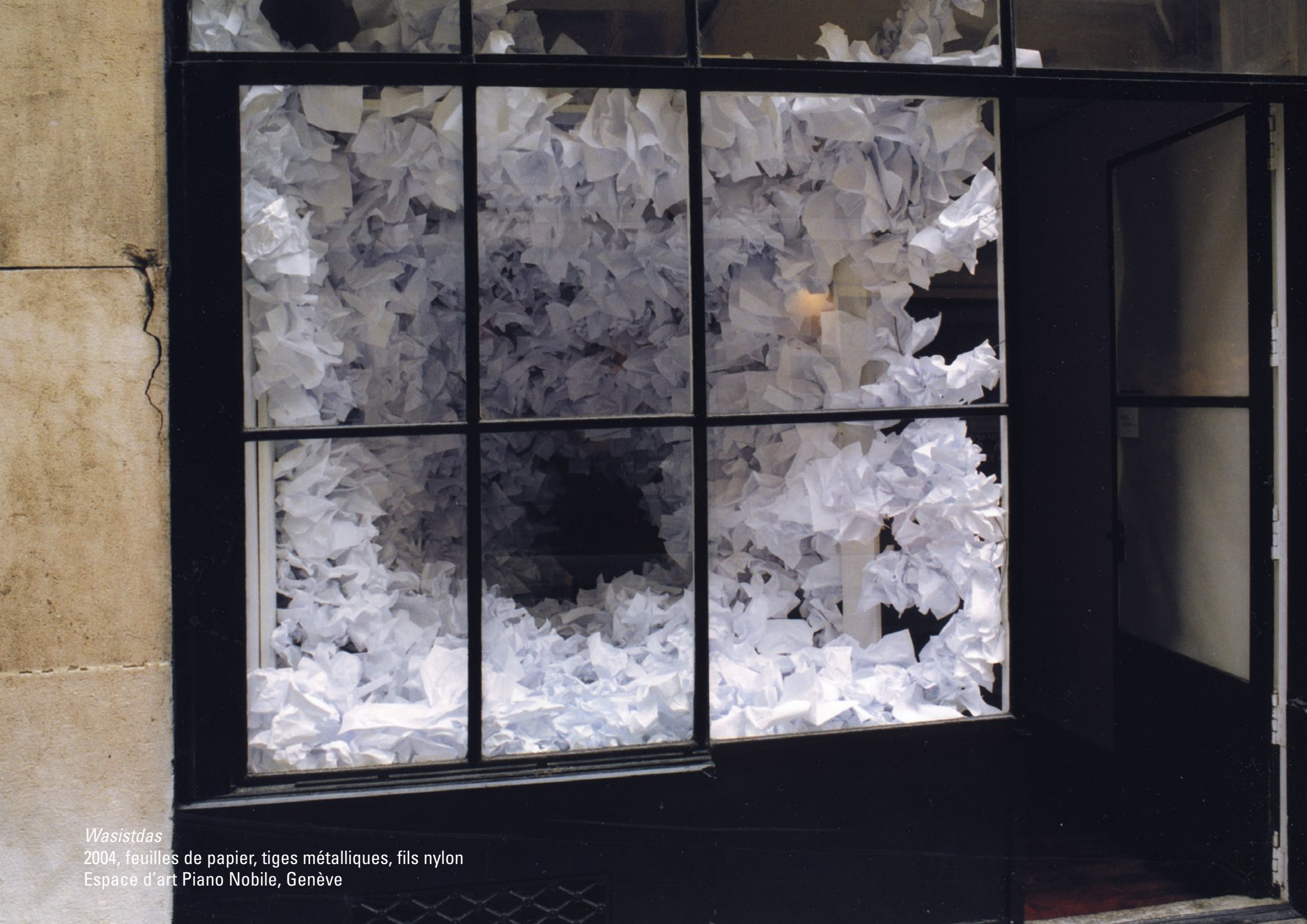
Wasistdas 2004, feuilles de papier, tiges métalliques, fils nylon Espace d'art Piano Nobile, Genève