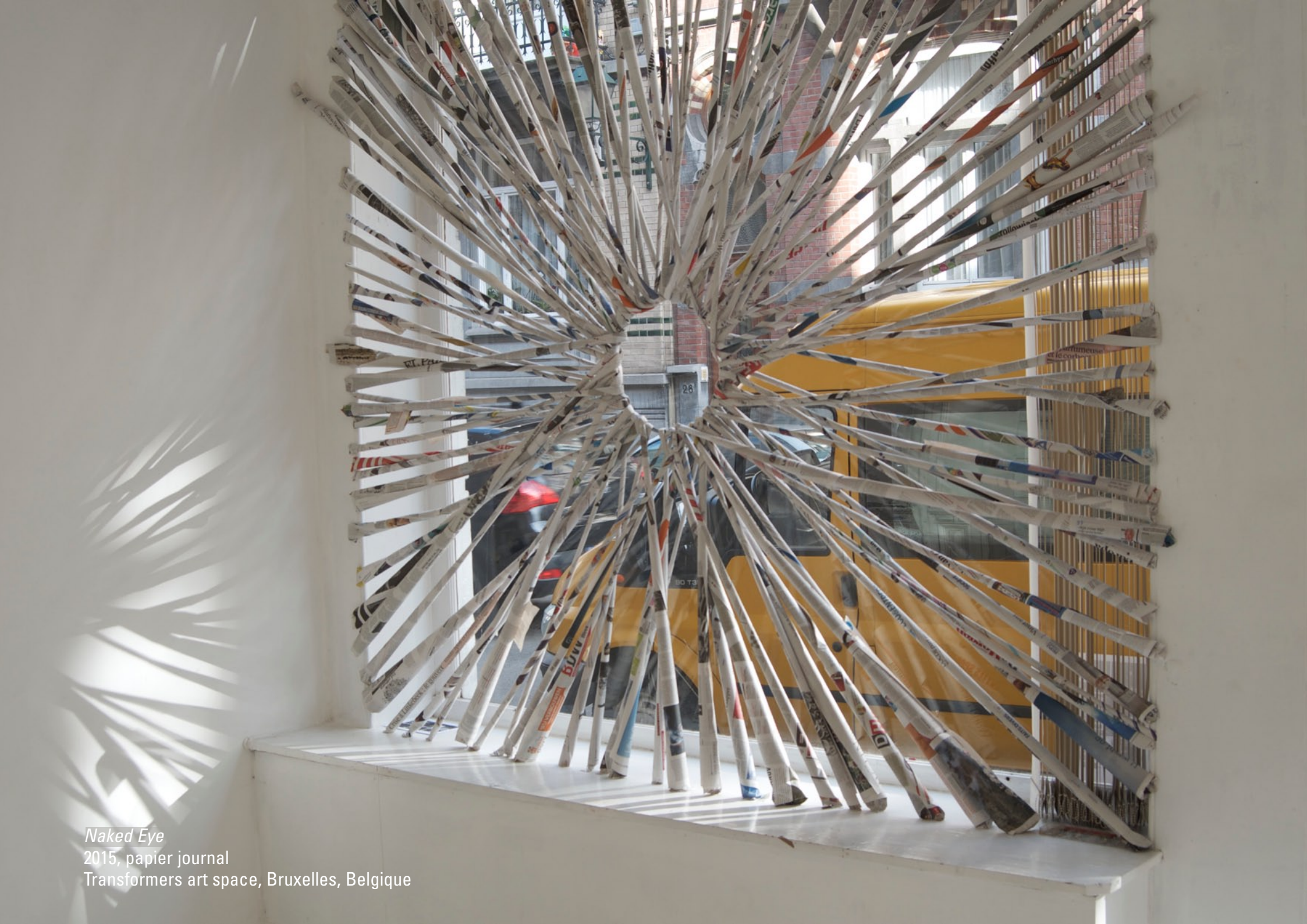
Naked Eye 2015, papier journal Transformers art space, Bruxelles, Belgique