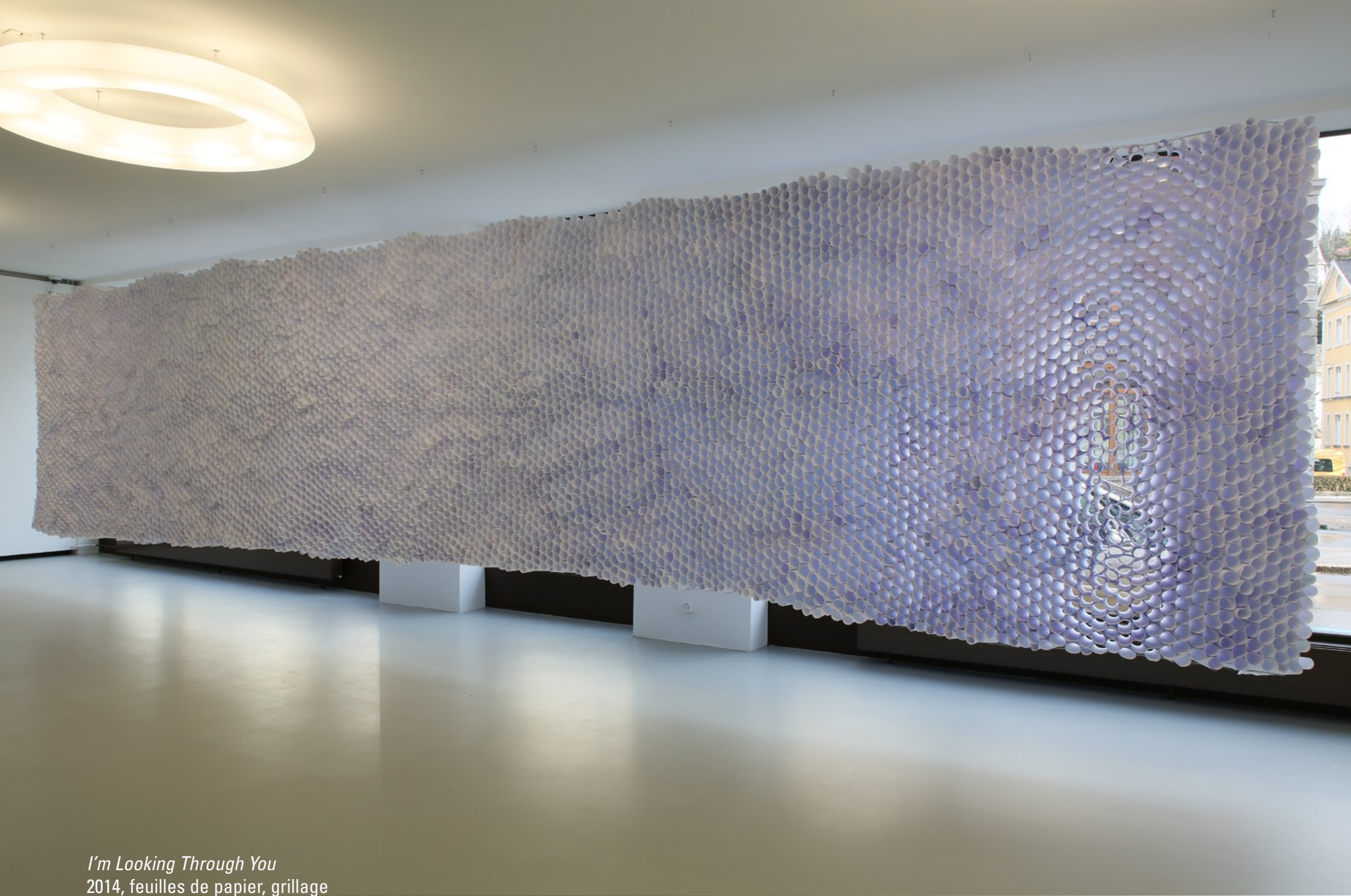
I'm Looking Through You 2014, feuilles de papier, grillage exposition de réouverture, Musée des beaux-arts, Le Locle