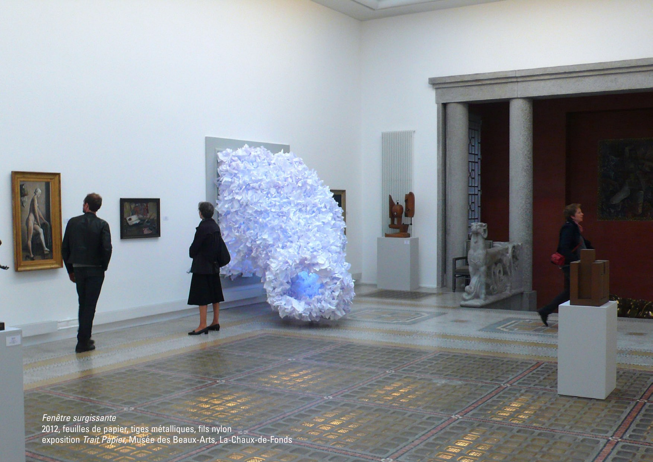
Fenêtre surgissante 2012, feuilles de papier, tiges métalliques, fils nylon exposition Trait Papier , Musée des Beaux-Arts, La-Chaux-de-Fonds