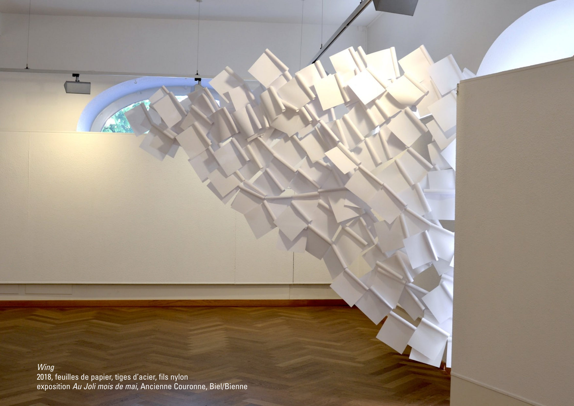
Wing 2018, feuilles de papier, tiges d'acier, fils nylon exposition Au Joli mois de mai , Ancienne Couronne, Biel/Bienne