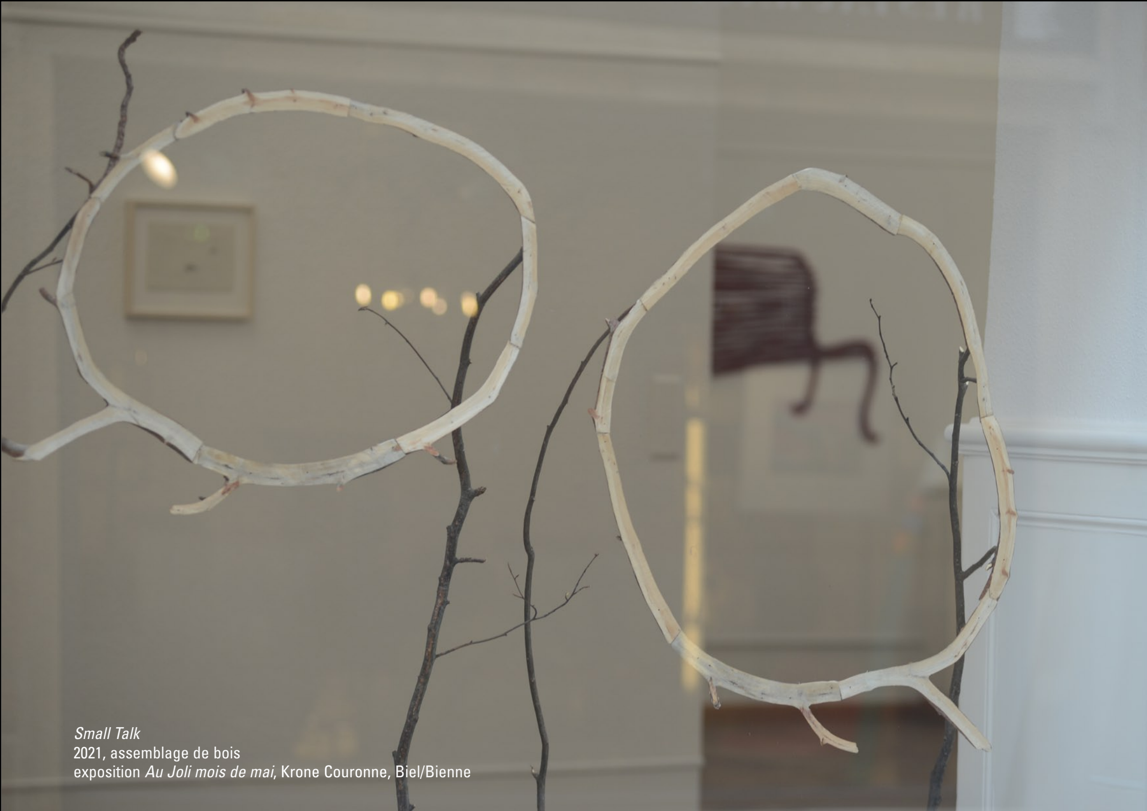
Small Talk 2021, assemblage de bois exposition Au Joli mois de mai , Krone Couronne, Biel/Bienne