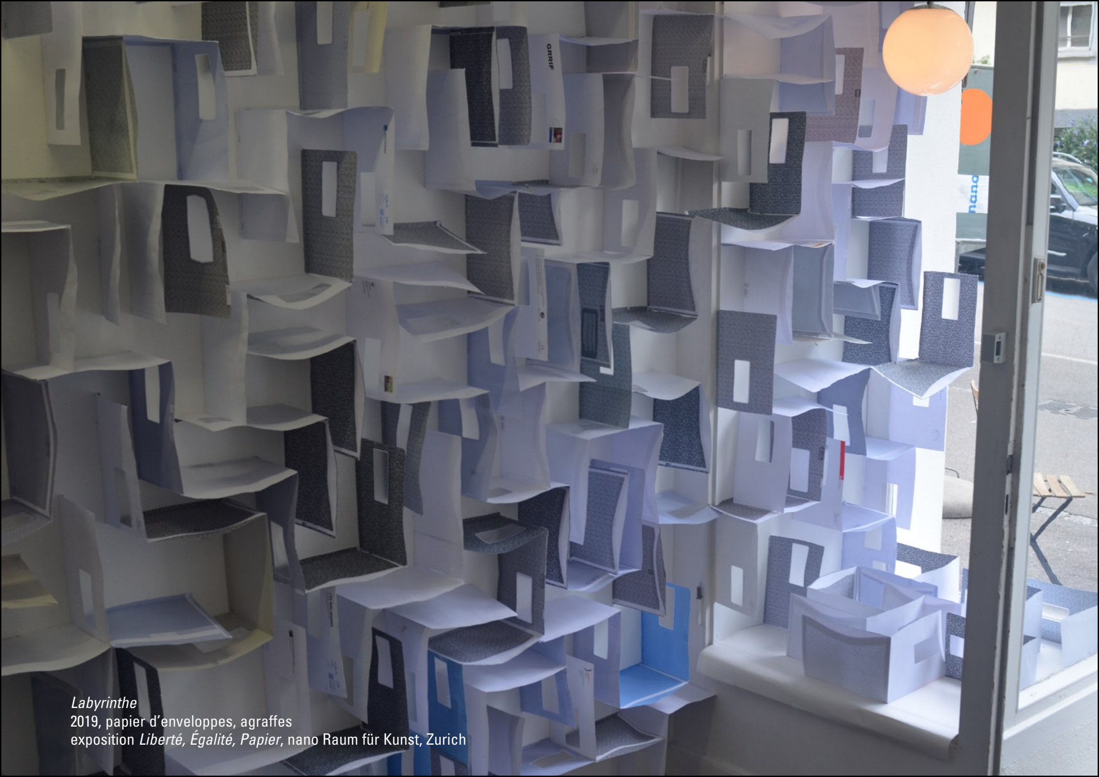
Labyrinthe 2019, papier d'enveloppes, agrafes exposition Liberté, Égalité, Papier , nano Raum für Kunst, Zurich